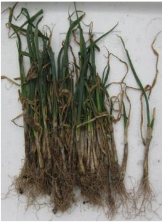
図1 ネギ萎凋病の罹病個体