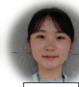
櫻井 SC (さくらい)