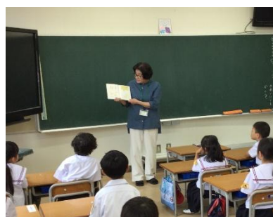
真剣に話を聞いている1年生

1～3年生はグリーンタイムにそれぞれのクラスで、4～6年生については昼休みに、希望者を対象に図書室で実施しております。読み聞かせは、「子どもの想像力を育む」「リラックス効果がある」等々言われております。今年度は月1回のペースで行う予定です。