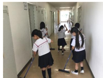
掃除をしている4年生の様子

最近は、自主的に掃除をする子どもたちの姿が見られるようになりました。学校がきれいになると気持ちがよいと感じているようです。場を清めることの大切さをしっかりと教えていきたいと思います。御家庭でも掃除を通してその大切さを伝えていただけたらと思います。