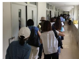
引き渡し訓練の様子