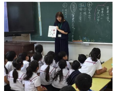
お話に入り込んでいる2年生