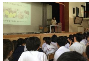
文化講演会の様子

ただ実際は、道路等が寸断され、引き渡し自体がすぐにできないことも考えられます。学校は、購入していただいた防災備蓄品を活用しながらお子様を留め置く対応をいたしますが、引き渡しが可能になった場合は、状況を鑑みながら安全第一の対応をお願いいたします。