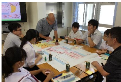
【考えをまとめている様子】