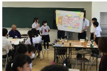
【考えを皆に伝えている様子】