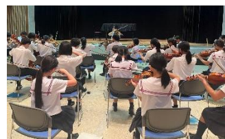
【会場での事前練習の様子】

7月24日、弦楽合奏団が山口県学生合奏コンクールに出場しました。今年度より、義務教育学校として、前後期が1つのチームとして活動してきたところですが、コンクールでは金賞と教育長賞をいただくことができました。日本学校合奏コンクール2025 全国大会グランドコンテスト にも出場が決まりましたが、活躍することを祈っております。関係する児童生徒の保護者様におかれましては、多くの面で御協力いただき感謝しております。