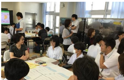
【互いに考えを確認している様子】

後半は協議会委員で、学校の課題について意見交換をいたしました。協議会委員の皆様、参加された児童生徒の皆様、ありがとうございました。