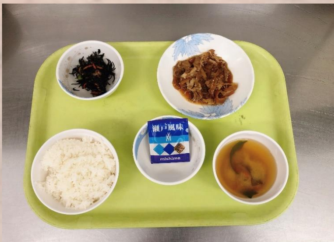
牛皿朝定食 ￥100(通常360円)