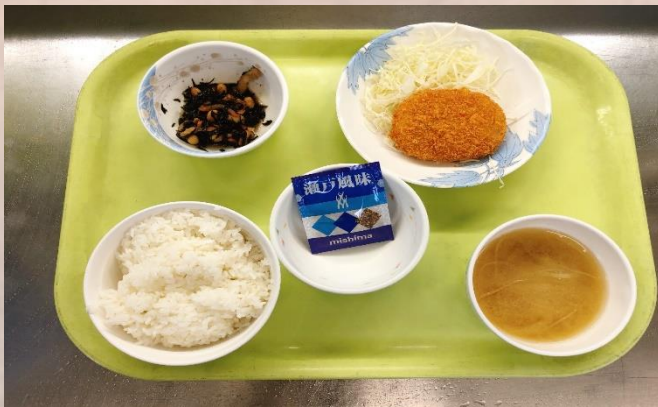
コロッケ朝定食 ￥50(通常260円)