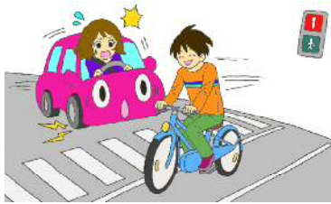
しんごうむし 信号無視