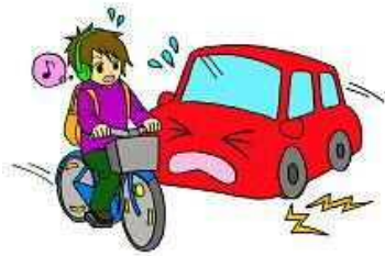
ヘッドホンステレオ等を 聞きながらの運転