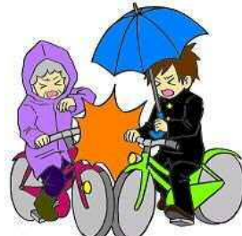
かさかさ 傘差し運転