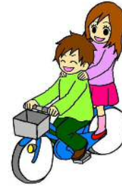
ふたりの 二人乗り