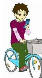
けいたいでんわ 携帯電話の使用