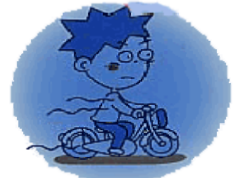
むとうかうんてん 無灯火運転