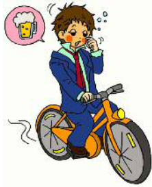
いんしゅうんてん 飲酒運転