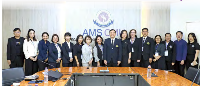
エグゼクティブミーティングのメンバー

❖ The Asia Pacific Alliance of Health Leaders (APAHL) is an international exchange program designed to cultivate future leaders in nursing and health sciences across the Asia-Pacific region. With a rich history spanning more than 20 years since its inception in 2005, it stands as a unique international collaboration for the School of Health Sciences, currently involving five universities, including Yamaguchi University. Each year, participating universities take turns hosting a four-day forum. The forum features a dynamic and educational program, encompassing discussions and presentations based on an annual theme, as well as facility visits and cultural immersion. ❖