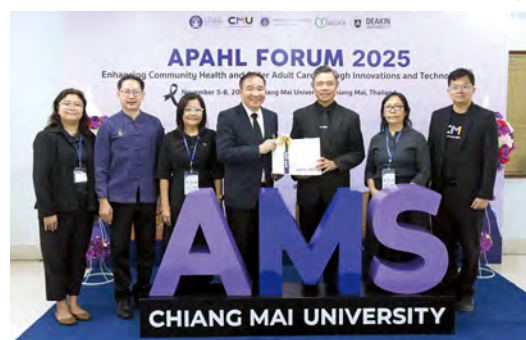
チェンマイ大学医療関連学部 主催者の先生方