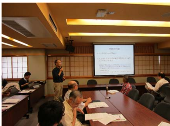
全学で実施されている教育改善FD研修会

また、YU CoB CuSの検討については、先行導入している国際総合科学部及び人文学部の事例を紹介しながら、現行のカリキュラムマップ、カリキュラムフローチャートに基づく作成作業の方向性に関する説明を行っています。