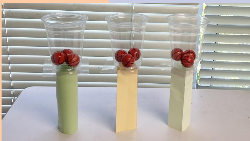
写真イメージです