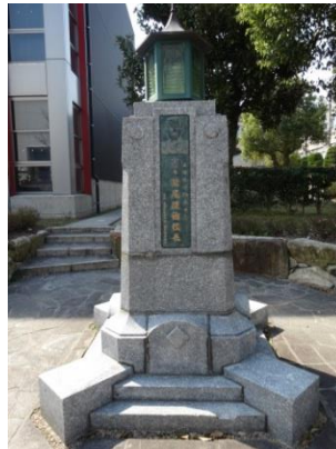
⑨-1 石造台座 （経済学部）