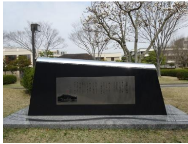
⑧-2 山都逍遥歌碑 （経済学部）