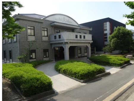
⑨-2 商品資料館（手前） 東亜経済研究所（奥）