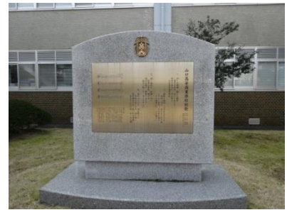
⑧-3 山口高等商業学校校歌碑 （経済学部）