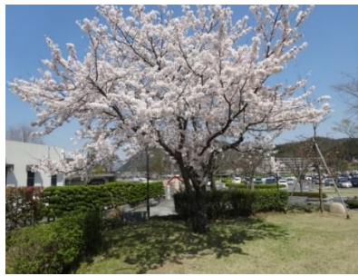
② 創立30周年記念植樹の桜