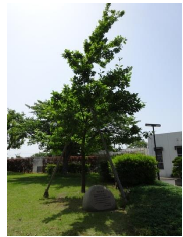
④ ロンドン大学と山口大学の 交流記念植樹