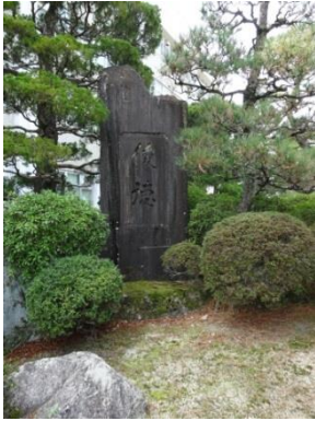
⑥ 皇太子殿下下行幸 記念碑（教育学部）