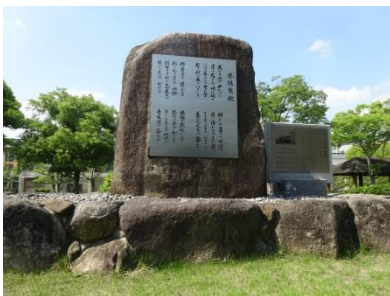
⑧-1 鳳陽寮歌碑 （経済学部）