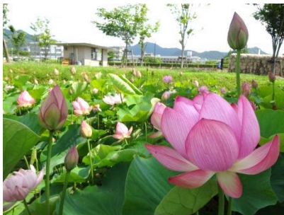
① ハス池 (大賀ハス)