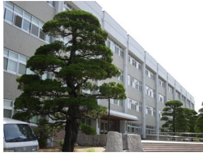
⑦ カイツカイブキ （教育学部）