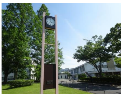
⑤ 創立 30 周年記念の時計台