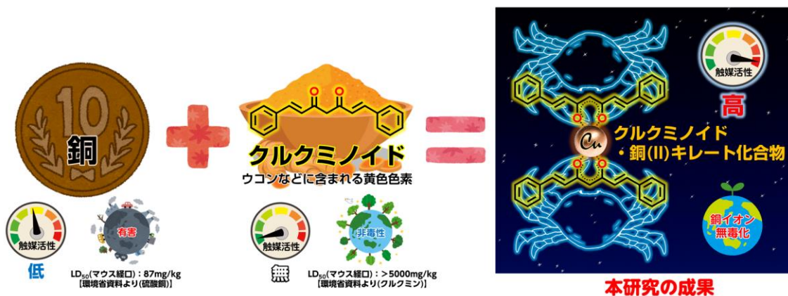
図2 本研究の触媒設計戦略の概要