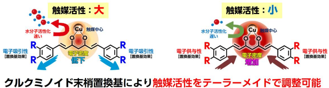
図3 クルクミノイド・金属キレート化合物による触媒活性制御