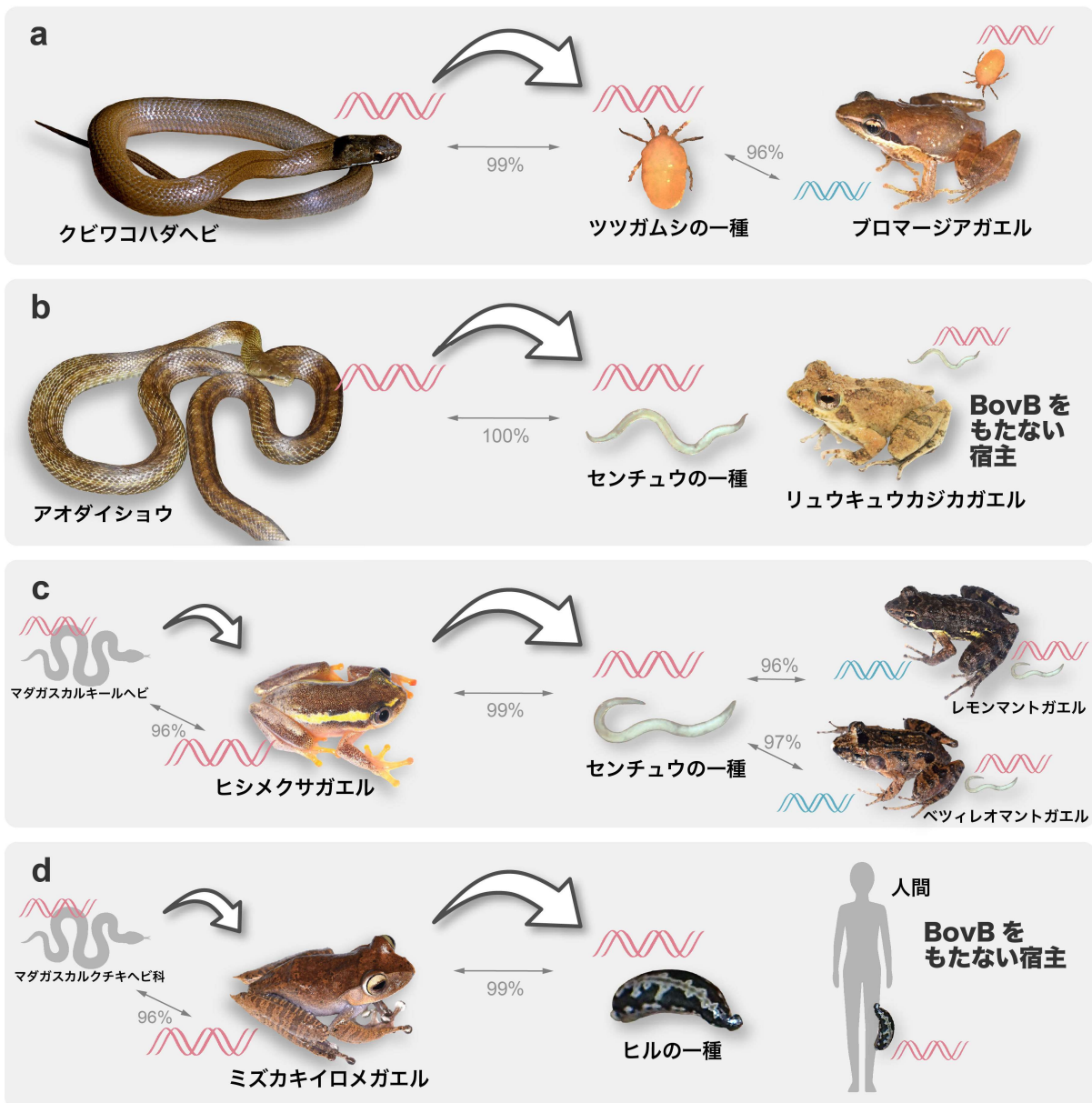
図 1. 寄生虫を介した水平伝播経路の代表例。太い矢印は伝播の方向、細い矢印は動物間の BovB の塩基配列相同性を示す。赤色の DNA は、ヘビからカエル、もしくは、ヘビから寄生虫に水平伝播した BovB、青色は、カエルが元々もっていた寄生虫とは異なる BovB を示す。