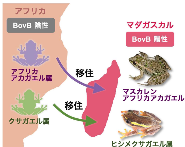
図3. これら2系統のカエルでは、アフリカからマダガスカルへ移住した後に水平伝播が生じた

続いて、水平伝播の経路を調査するため、ヘビ-カエル間を行き来することのできる寄生虫を水平伝播の仲介者と仮定し、PCR法（注3）による調査を行ったところ、BovBをもったまま宿主間を移動している有力な仲介者候補が発見されました（図1）。