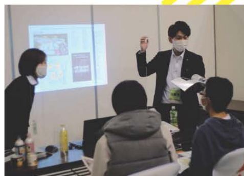
出展ブースイメージ