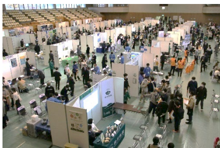
▲アリーナ内の様子