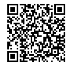
見学登録 フォーム