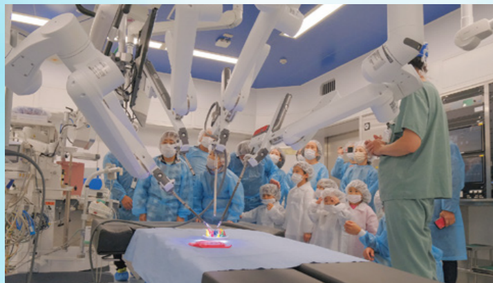
手術支援ロボットの操作体験

2025年9月、足かけ11年にわたる事業が完了しました。長らくご協力いただいた皆様へ感謝の思いを伝えるため、11月8日(土)に「山大病院感謝祭」を開催。約1,600名が来場され、改めて地域の皆様に支えられていることを実感する機会となりました。