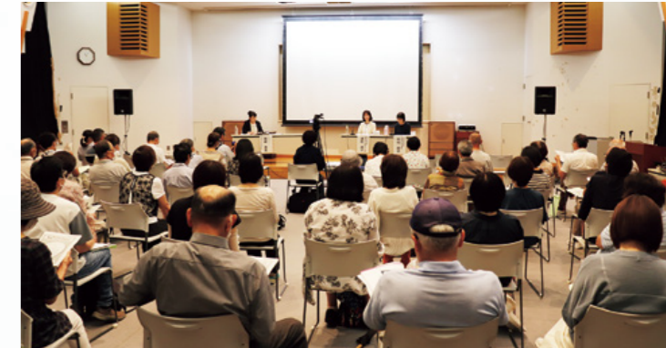
毎回多くの方が熱心に聴講されます