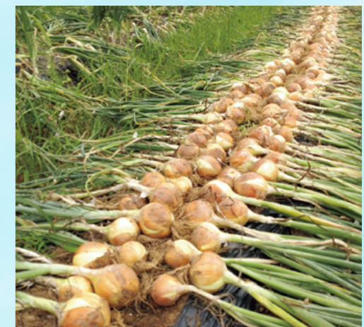
農学部学生が生産した野菜を病院食に活用

本院では持続可能な地域医療の実現のため、安心・安全な高度・先進医療の提供に努めてまいります。本院が未来に向けて発展していくために、皆様の温かいご支援を引き続きよろしくお願いいたします。