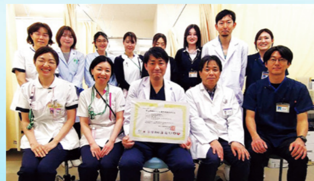
植込型補助人工心臓(VAD)管理チーム