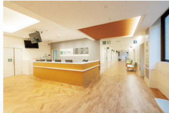
分かりやすい動線と待合スペースを整備した外来

本院は、山口県内で唯一の特定機能病院、また大学病院としての役割を果たすべく、高度・先進医療の提供、及び医療人の育成に努めています。2014年には地域医療の将来を見据え、国立大学病院として初となる2回目の再開発整備事業をスタートしました。