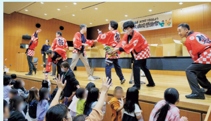
感謝祭のフィナーレを飾る餅まき